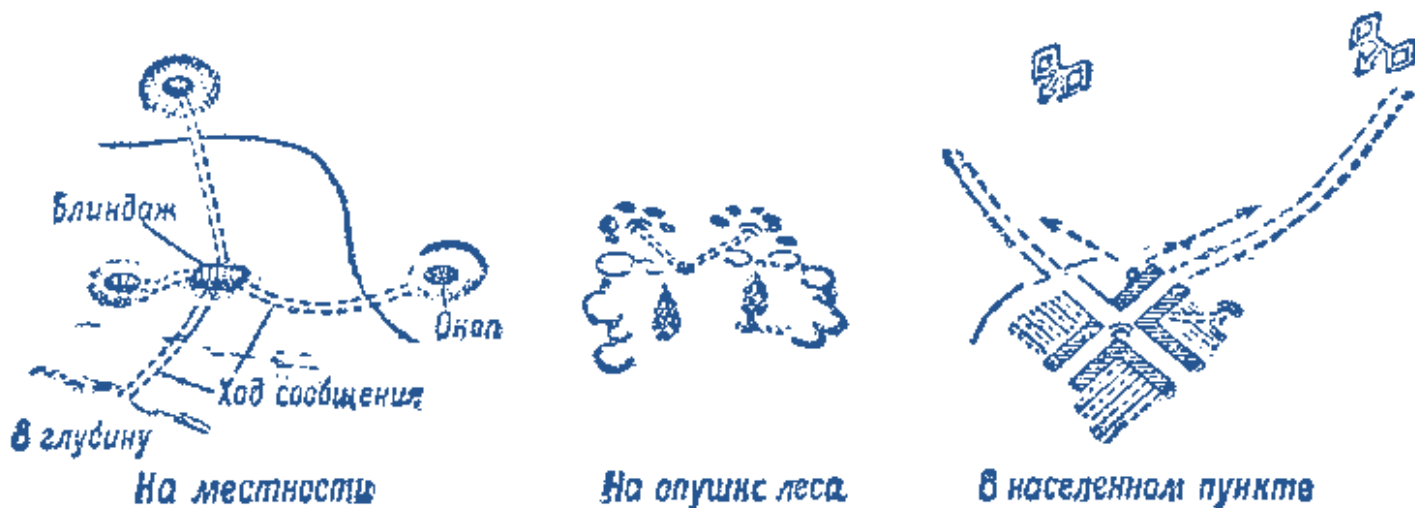
Рис. 1. Оборудование огневых позиций противотанковых (ПТ) ружей

При оборудовании огневой позиции на открытой местности устрой надежный блиндаж с перекрытием из деревянных брусьев или другого подручного материала с земляной насыпью. От блиндажа в разные стороны 15-- 25 м и в глубину сделай скрытые ходы сообщения ("усы") к окопам. Окопы (гнезда) для ведения огня устраивай в виде круглых площадок с расчетом возможности вести огонь во все стороны.